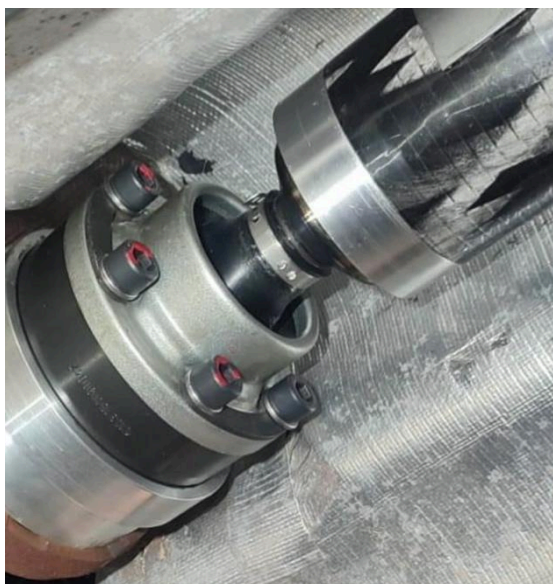
Zdj. nr 3 - Montaż przegubu w kryzę