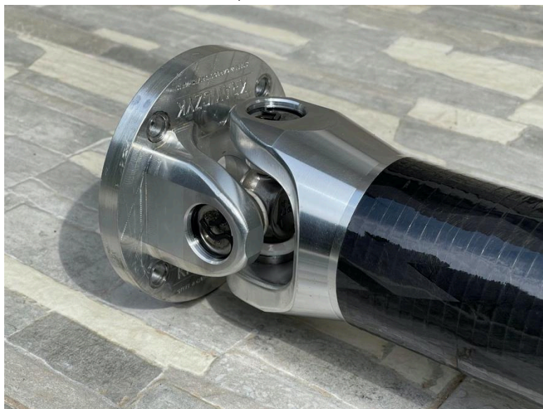
Zdj. nr 2 - Złącze kołnierzowe

M8x - 12.9 - 40Nm , M10x35mm - 12.9 - 79Nm