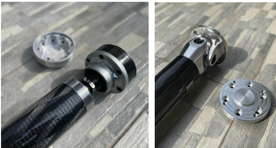
Zdj. nr 1 - Kryzy montażowe